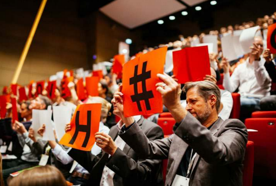
#positivefootprint Teilnehmende C2CC18